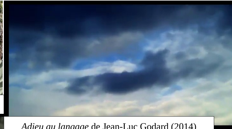
Adieu au langage de Jean-Luc Godard (2014)