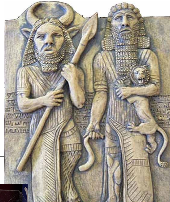
Enkidu et Gilgamesh