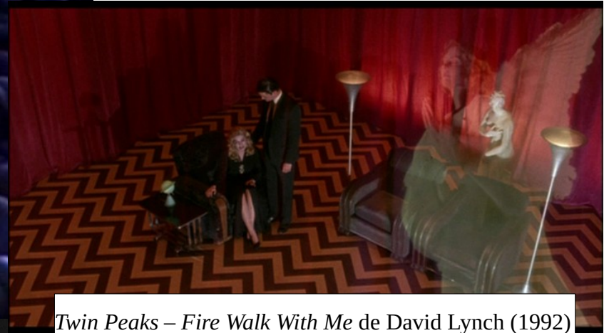
Twin Peaks – Fire Walk With Me de David Lynch (1992)