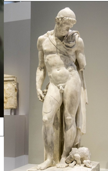
Ulysse reconnu par son chien Argos de Etienne-Jules Ramey (1815)

« Nous nous dressons l'une l'autre à accomplir des actes de communication que nous maîtrisons à peine. Nous sommes, constitutivement, des espèces de compagnie. Nous nous construisons mutuellement dans La chair. Partenaires réciproques, dans nos différences spécifiques, nous sommes l'incarnation d'une vilaine infection développementale qui s'appelle l'amour. »