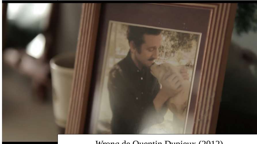
Wrong de Quentin Dupieux (2012)