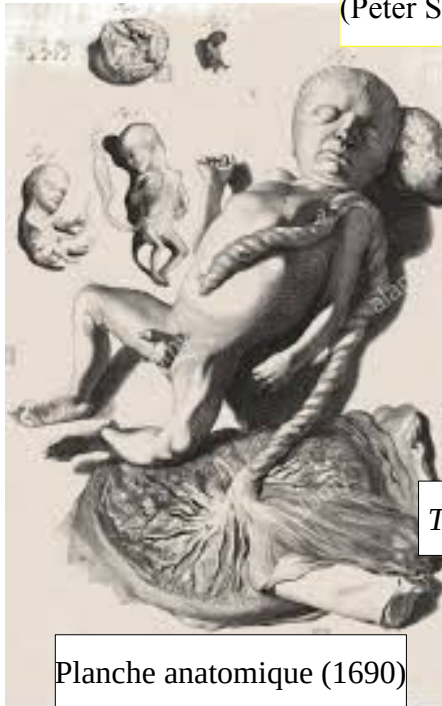
Planche anatomique (1690)

« L'expression est un emprunt érudit au terme latin désignant les gâteaux plats ou le pain en galette, placenta, lequel remonte pour sa part à un terme grec ayant la même signification, plakous, plakounia à l'accusatif. Celui-ci est apparenté à l'expression austro-hongroise palatschinke, qui désigne la crêpe. » (Peter Sloterdijk, Sphères, tome 1 : Bulles , éd. Hachette/Pluriel, 2002, p. 407).