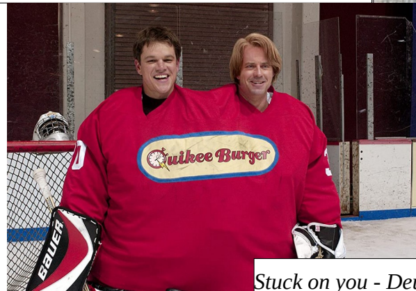
Stuck on you - Deux en un de Peter et Bobby Farrelly (2003)