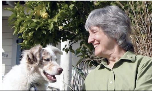
Cayenne et Donna Haraway

« Le chien est le seul être qui t'aime plus qu'il ne s'aime lui-même. » (Fritz Von Unrub)