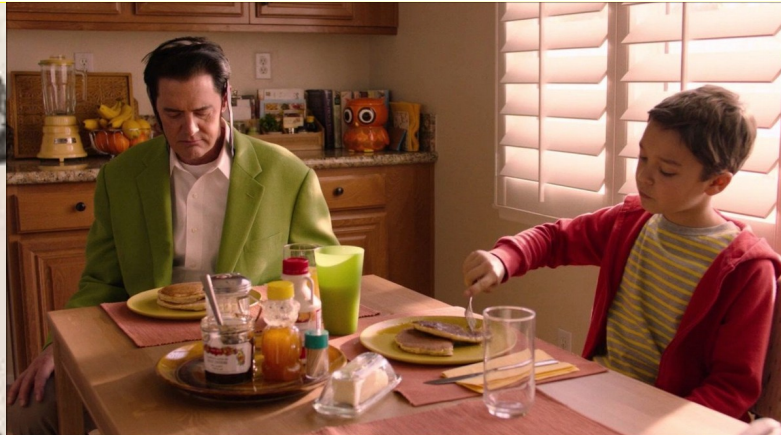
Twin Peaks – The Return de Mark Frost et David Lynch (2017)