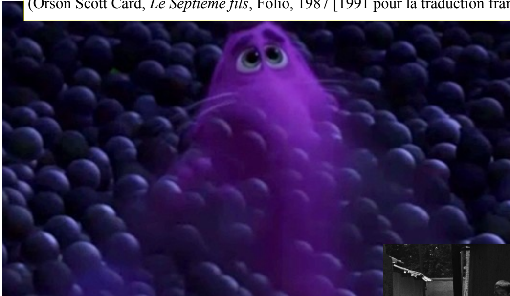
Inside out – Vice Versa de Pete Docter et Ronaldo Del Carmen (2015)

(Orson Scott Card, Le Septième fils , Folio, 1987 [1991 pour la traduction française], p.57)